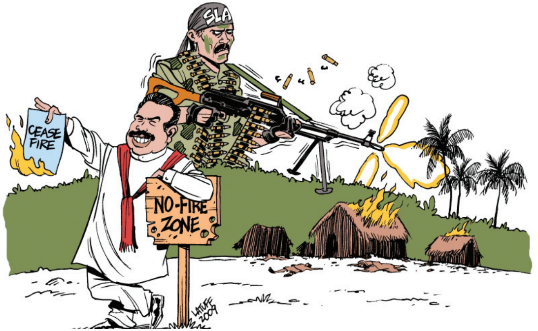
STATSTERROR: Sri Lankas myndigheter nekter tamilene grunnleggende menneskerettigheter.